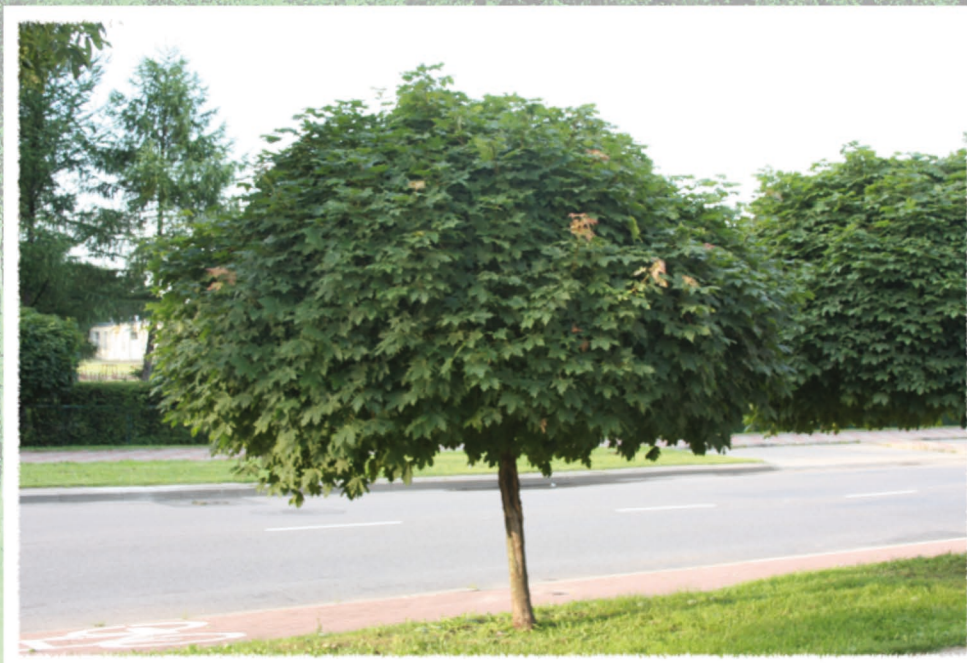
(klon pospolity - odmiana globosum)

Rodzime gatunki drzew też mają swoje ozdobne odmiany.