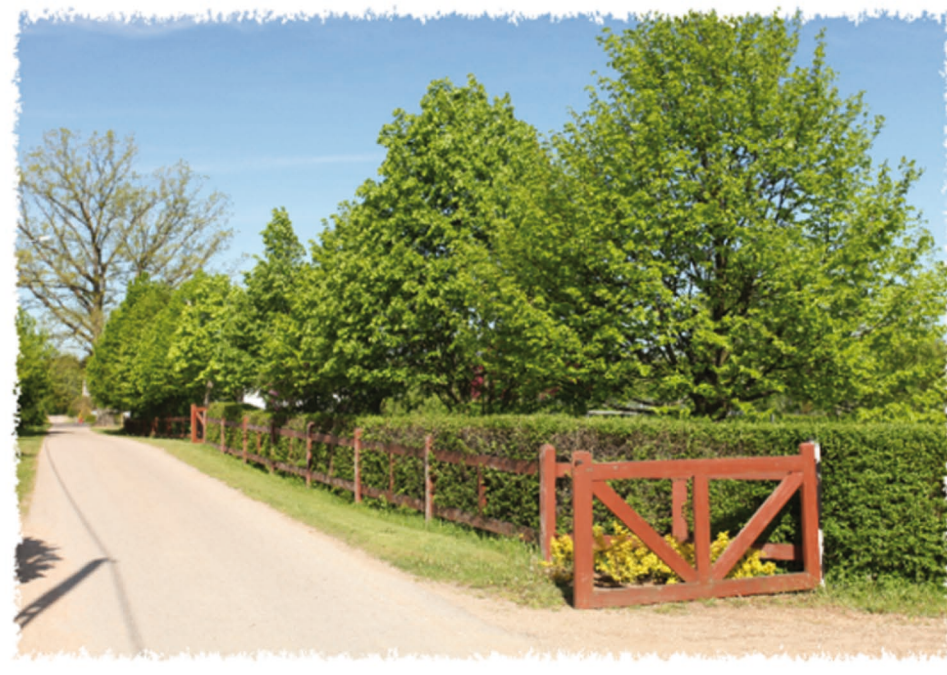
(szpaler lip w żywopłocie)

Sadźmy piękne, rodzime gatunki drzew zamiast tuj w żywopłocie